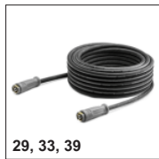
29, 33, 39